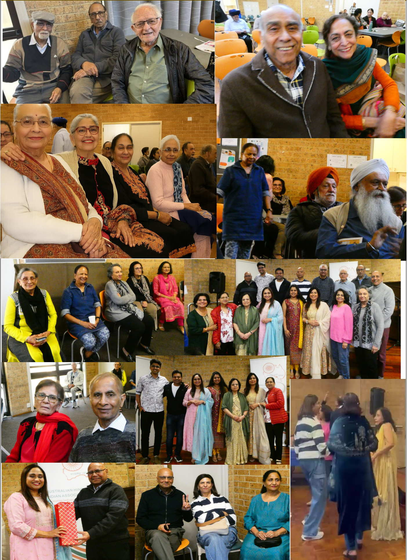
AHIA Seniors Meeting on 9th May, 2026