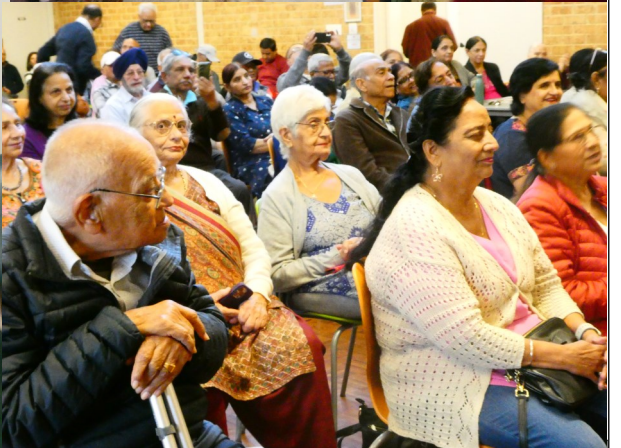
AHIA Seniors Meeting on 9th May, 2026